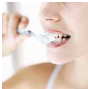
Redan efter några veckor kan resultatet märkas.