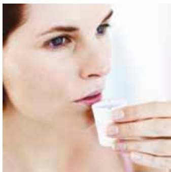
Skölj med Decapinol munskölj två gånger per dag.